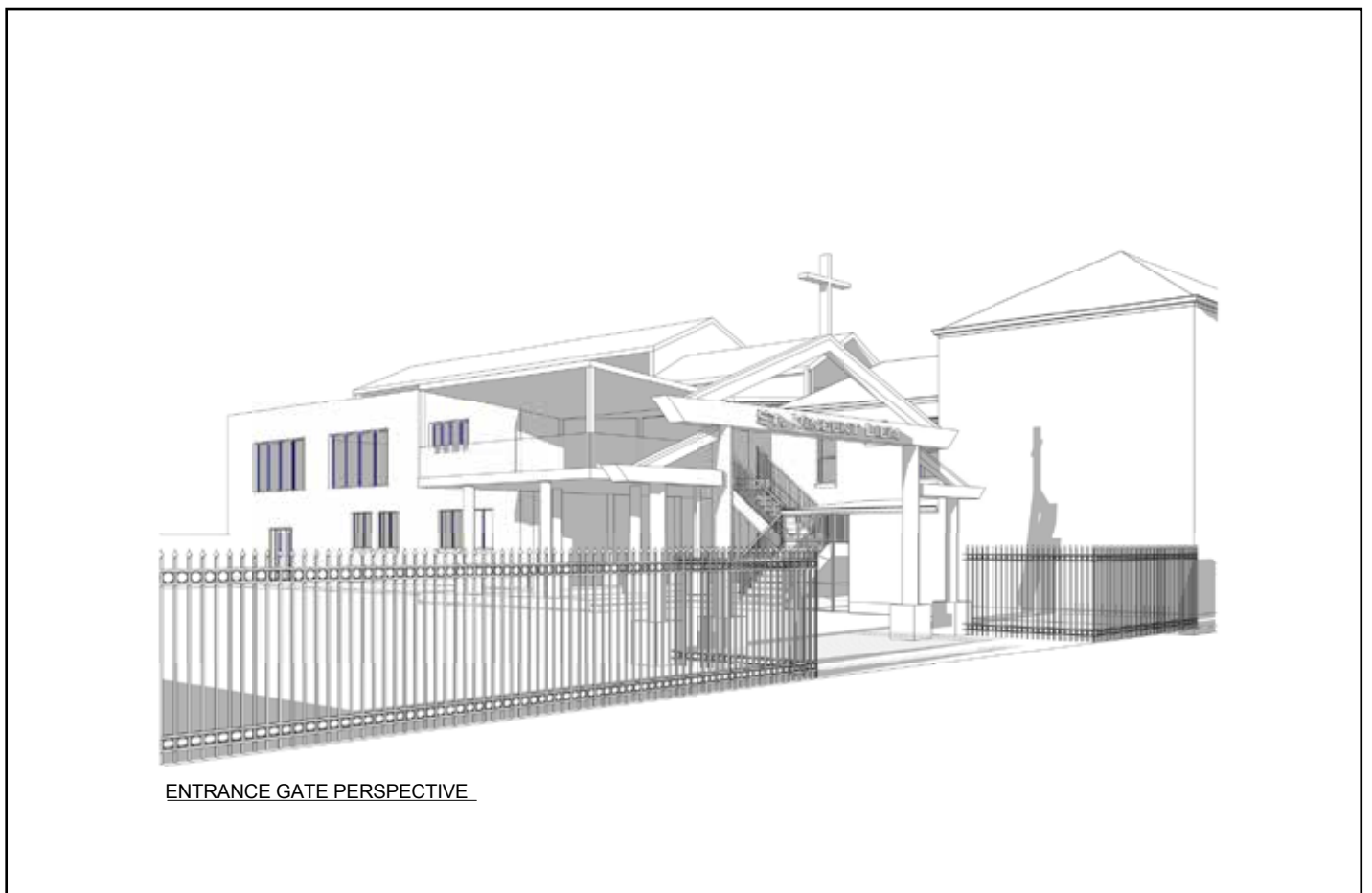
Sơ Đồ Cổng Trung Tâm Vinh Sơn Liêm